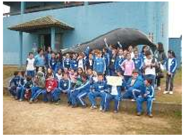
Visita ao Projeto Baleia Franca