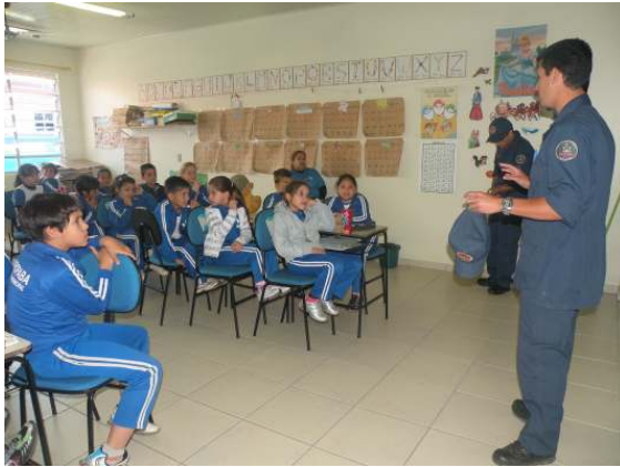
Palestra 1os Socorros em Trilhas