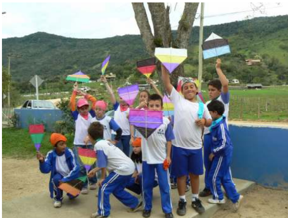
Oficina de Pipas