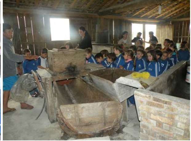
Visita ao Engenho de Farinha