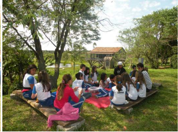
Visita ao Gaia Village