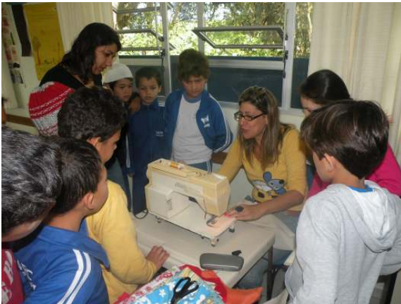
Oficina de Eco Bags