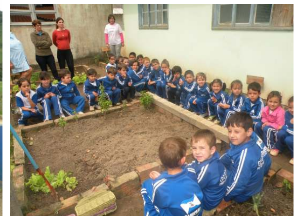
Oficina de Horta Permacultural