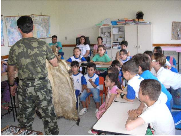
Palestra sobre atuação da Polícia Ambiental