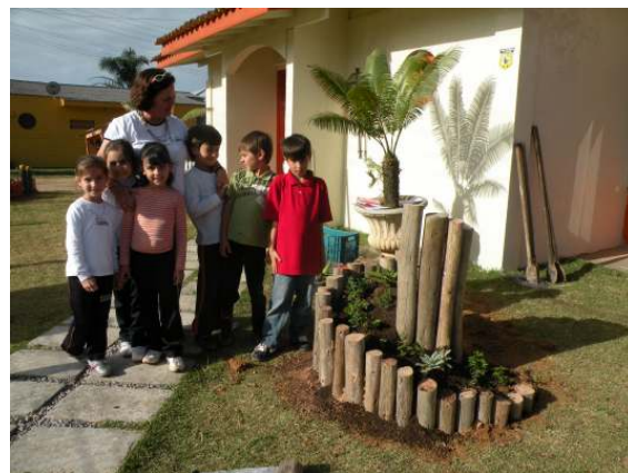
Oficina de Espiral de Ervas