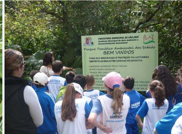
Visita à Escola do Meio Ambiente de São José