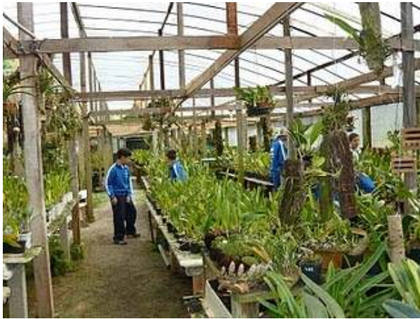
Visita ao Orquidário