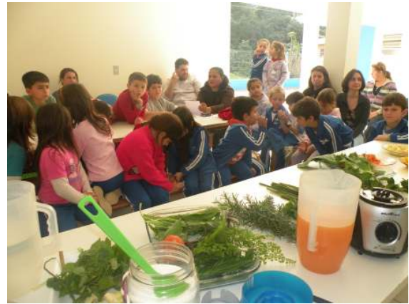
Oficina de Sucos Naturais