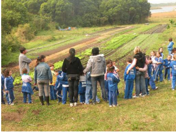
Visita ao Engenho de Farinha