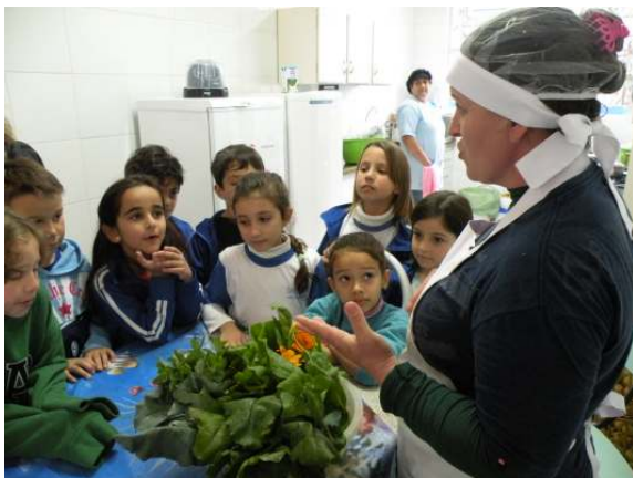
Oficina de Alimentação Saudável

*Os materiais e bens doados ao Empório que não foram solicitados pelas Escolas ficaram sob guarda da Coordenação da Mostra Lutz.