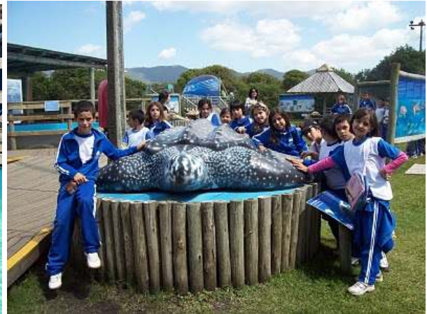
Visita ao Projeto TAMAR – Florianópolis