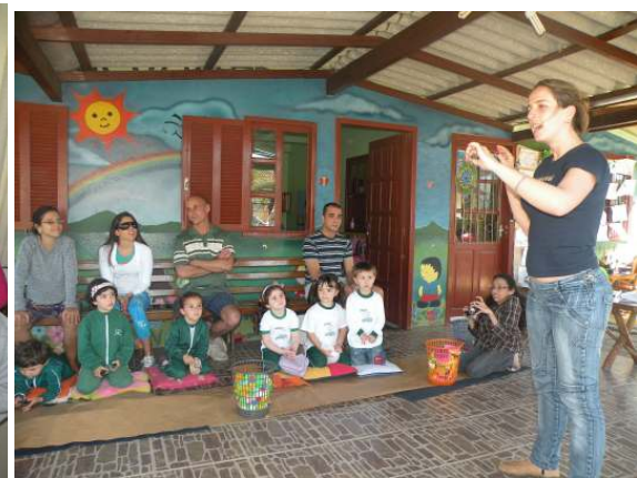
Oficina de Mandalas