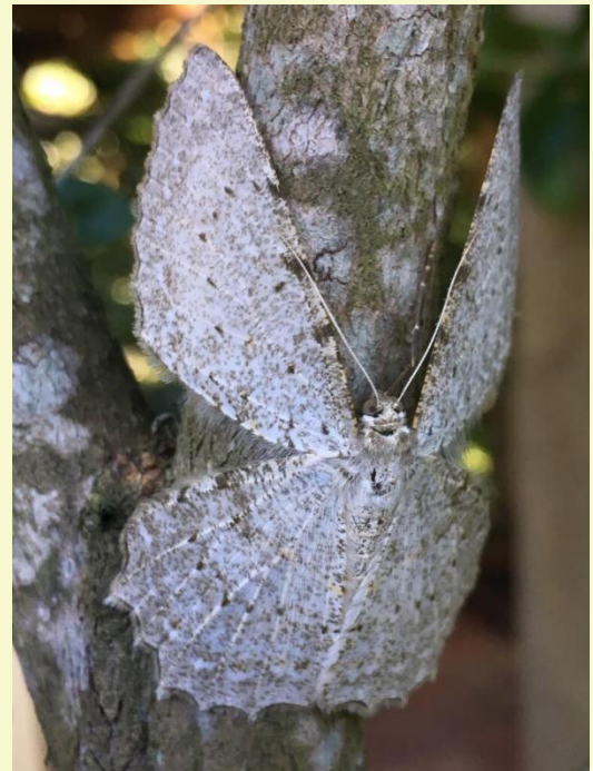
Imagem do Mês

Mariposa branca ( Epimecis puellaria ) mimetizada com tronco repleto de líquens