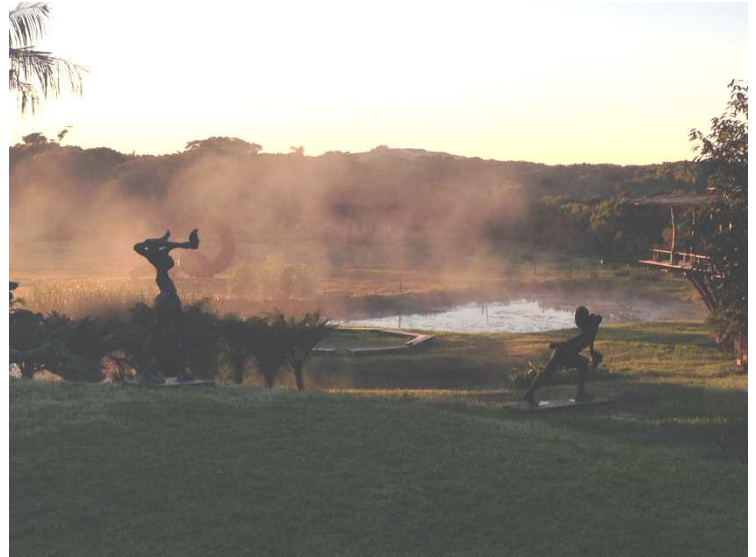
Manhã gélida na sede do Gaia.